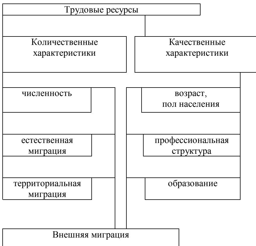
Рис. 3. Влияние внешней миграции на основные характеристики трудовых ресурсов 3

Следовательно, исходя из вышеизложенного, можно предположить, что экономическая функция миграции населения, если рассмотреть ее в самом общем виде, сводится к взаимосвязи средств производственной рабочей силы и их носителями – трудоспособным населением. Поэтому серьезным фактором экономического развития территории является внешняя миграция, так как она влияет еще и на количественные и качественные характеристики населения, а значит, и на трудовые ресурсы (рис. 3).