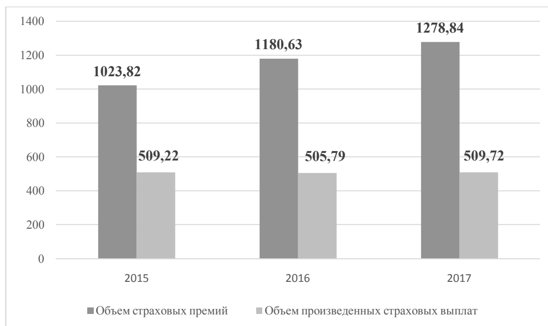
Рис. 1. Динамика страховых премий и выплат в 2015–2017 гг.

Наглядно динамика страховых премий и произведенных выплат представлена на рисунке 1.