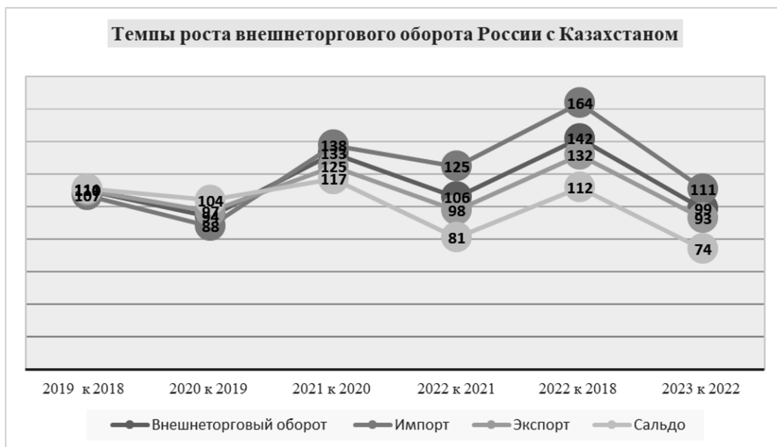
Рис. 2. Динамика темпов роста внешнеторгового оборота, экспорта и импорта России с Республикой Казахстан за период 2018–2023 гг. в стоимостном выражении, % 4

Fig. 2. Dynamics of growth rates of foreign trade turnover, exports and imports of Russia with the Republic of Kazakhstan for the period 2018-2023 in value terms, %